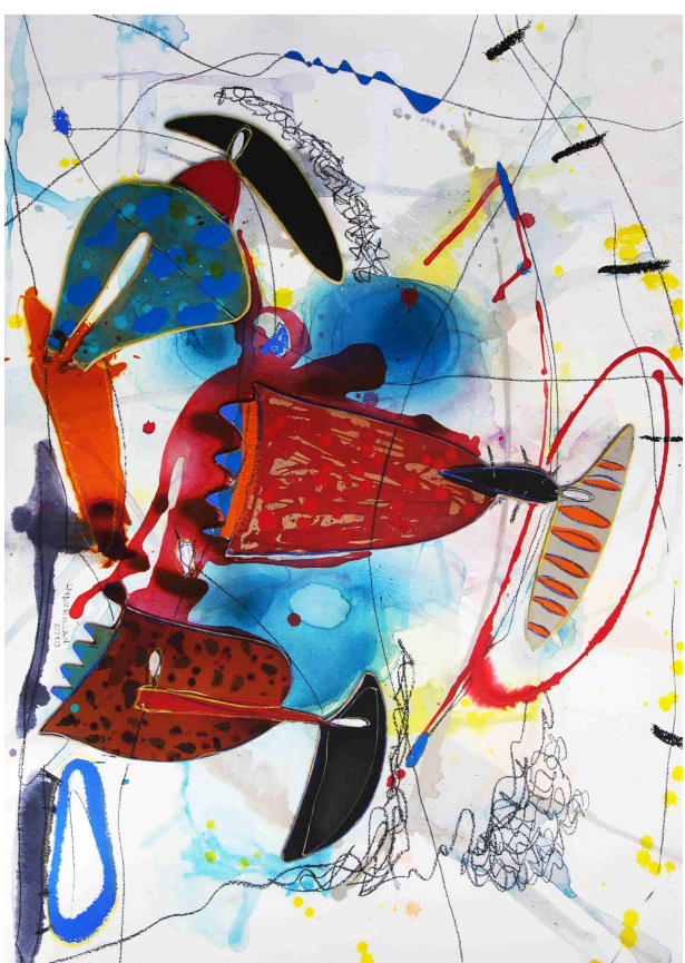
"son tres" / Técnica Mixta sobre papel / 77 x 106 cms