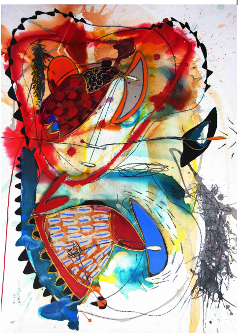
"y Floreció 3ª" / Técnica Mixta sobre papel / 77 x 106 cms