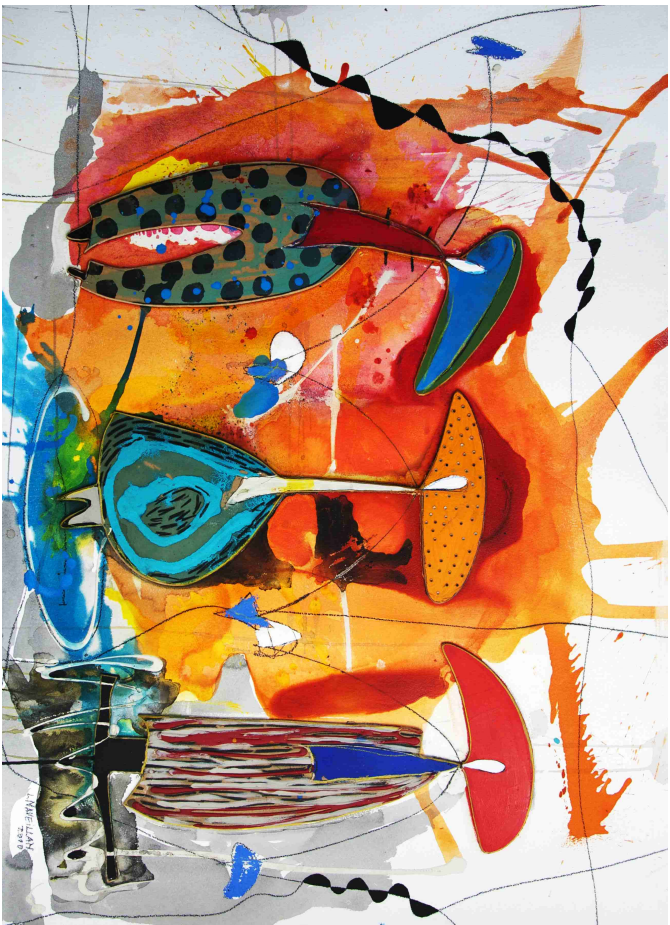
"entre hilos" / Técnica Mixta sobre papel / 77 x 106 cms