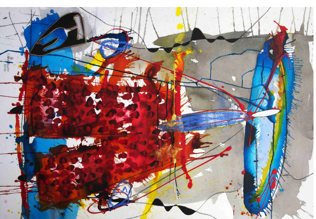
“serie pareja ii” / Técnica Mixta sobre papel / 106 x 77 cms