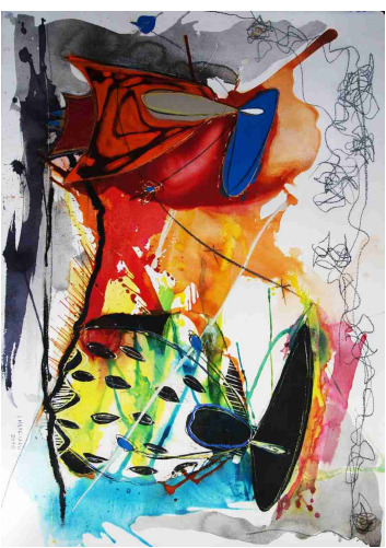
"ambas" / Técnica Mixta sobre papel / 77 x 106 cms