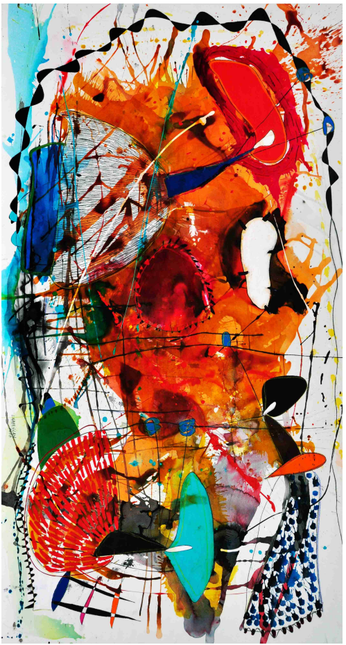
"escenario" / Técnica Mixta sobre papel / 110 x 210 cms