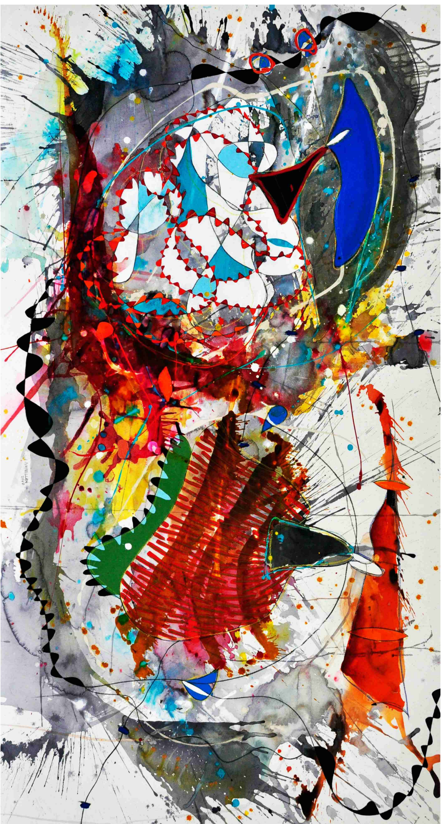
"mágico" / Técnica Mixta sobre papel / 110 x 210 cms