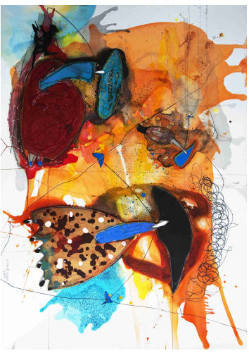
"el gato?" / Técnica Mixta sobre papel / 77 x 106 cms