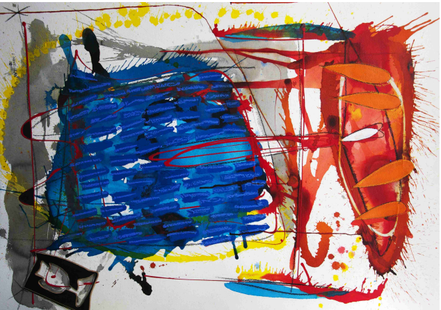
“serie pareja i” / Técnica Mixta sobre papel / 106 x 77 cms