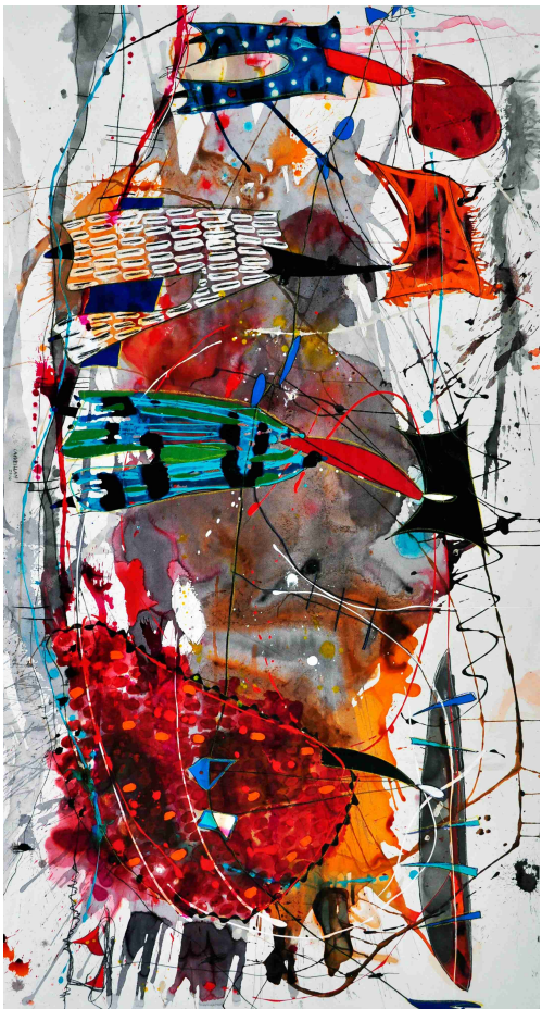
"para ella" / Técnica Mixta sobre papel / 110 x 210 cms