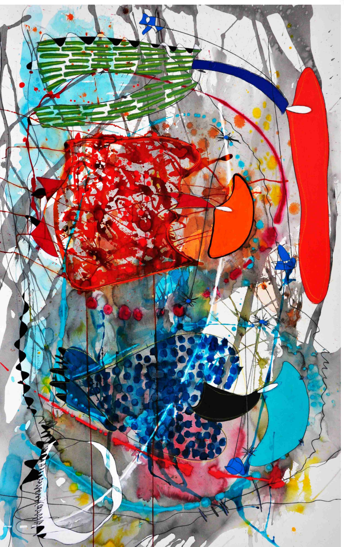
"equilibrio" / Técnica Mixta sobre papel / 110 x 180 cms